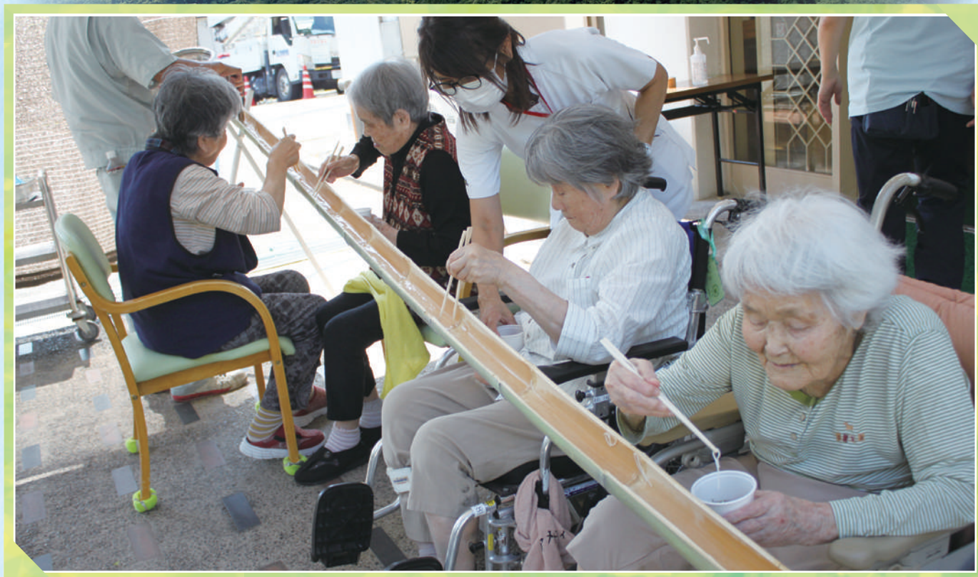
恒例のそうめん流しを楽しみました (藤戸荘玄関ポーチ)