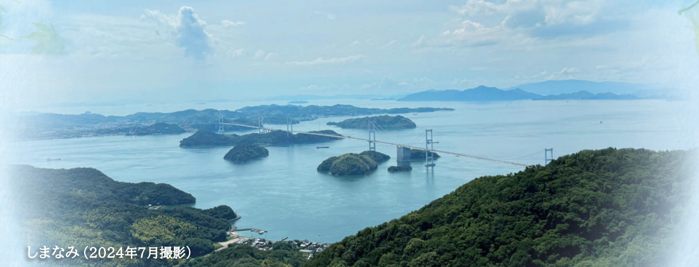
しまなみ (2024年7月撮影)