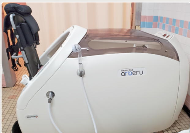
シャワーポッドアラエルシャワードーム

藤戸荘では利用者さまの体の状態に合わせて入浴ができる設備をご用意しております。8月1日には新しい機械浴槽を導入し、デモンストレーションと職員説明会を実施しました。これからも快適なケアの提供に努めてまいります。