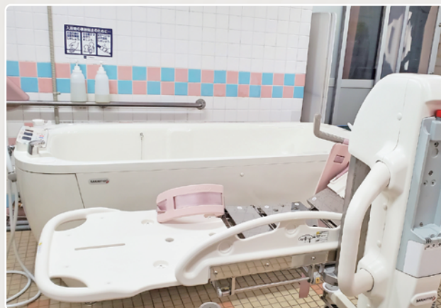
リクシー スタンダード浴槽

お肌に優しいウルトラファインバブルのボディシャワーと保温効果の高いシャワードームで、利用者さま・職員ともに負担の少ない入浴が可能になります。