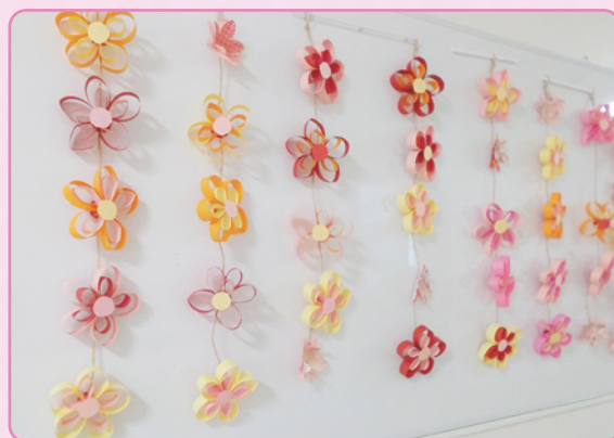
ホールの壁面装飾